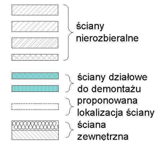
BUDYNEK A POŁOŻENIE LOKALU